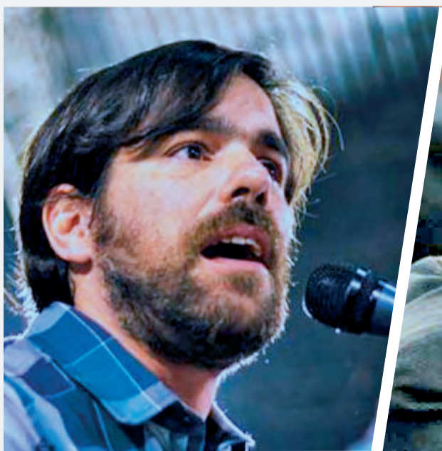
Nicolás Del Caño