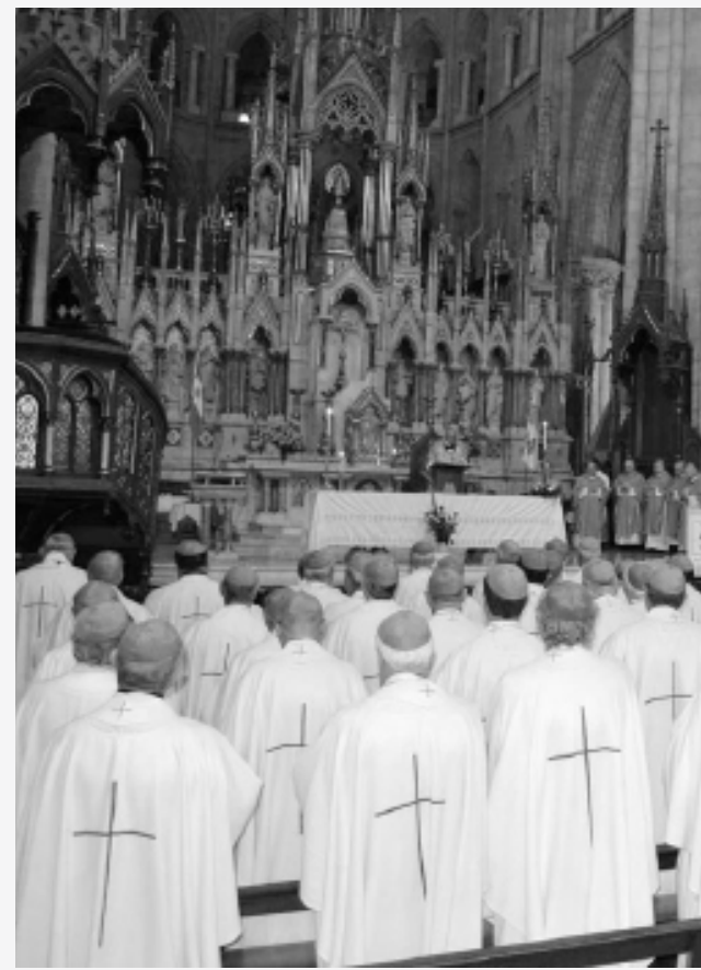
La cúpula de la Iglesia trabaja por la reconciliación con los genocidas

fuego, una política económica al servicio de los empresarios y el imperialismo, no saldría del molde de los "acontecimientos argentinos". El protocolo, además de ser una provocación ya desde su título, señala quienes podrán acceder a la información eclesial: "la víctima directamente o su representante con delegación explícita", el familiar directo de un desaparecido o de una persona que haya fallecido, los obispos o superiores mayores de las víctimas. Para obtenerla deberán completar una solicitud dirigida al Secretario General de la Conferencia Episcopal quien determinará si la consulta es "pertinente". La realidad es que la Iglesia no quiere colaborar con ningún archivo que aporte información relevante para esclarecer los crímenes de lesa humanidad, mucho menos que incrimine la complicidad de la institución con los militares. La Iglesia se ha lanzado, junto con los sectores más reaccionarios que se agruparon detrás de la fallida intentona de la Corte con su 2x1, a garantizar más impunidad para los genocidas escudada detrás del verso de la reconciliación.