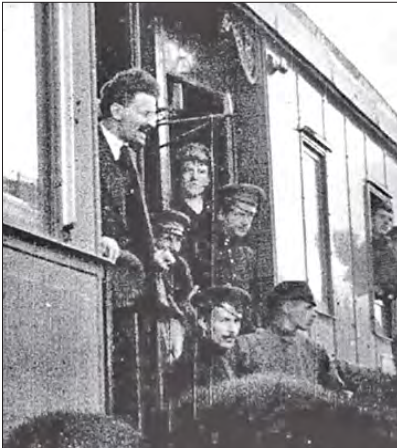
León Trotsky llega a Petrogrado

El 13 de enero de 1917, después de 17 días de travesía en un barco de bandera española (neutral en la primera guerra mundial), Trotsky y su familia llegaron a Nueva York. El revolucionario internacionalista ruso había sido expulsado de una Europa desangrada por la guerra. En 1905 había encabezado el soviét de Petrogrado (véase El Socialista N°19). En diciembre, cuando la revolución fue derrotada, toda la conducción soviética fue detenida. Trotsky y otros dirigentes fueron juzgados y condenados. En 1907 se fugó y comenzó su segundo exilio, esta vez de diez años. Primero en Austria, luego en Francia y por último en Nueva York. Allí alquilaron un modesto cuarto en un barrio obrero por solo 18 dólares al mes que, para su sorpresa, poseía “luz eléctrica, cocina a gas, cuarto de baño, teléfono” y otras “comodidades inconcebibles para un europeo”*. En escasos dos meses todo eso quedaría atrás.