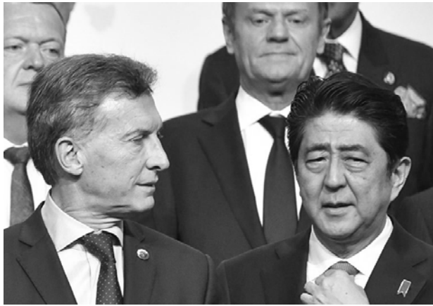
Macri y el primer ministro japonés Shinzo Abe

El gobierno pretende presentar la gira de Macri por Asia como un gran logro, que traerá inversiones y nos abrirá al mundo. Las mismas mentiras que dijeron Néstor y Cristina Kirchner cuando anunciaron grandes inversiones de China que nunca se concretaron.