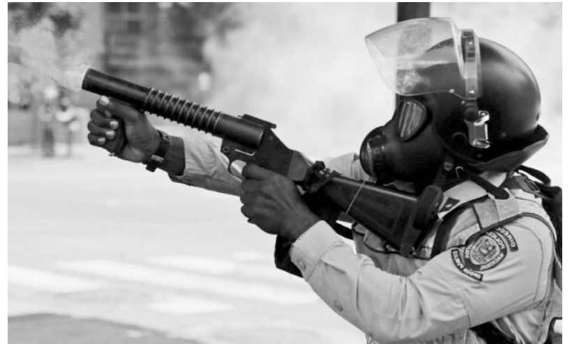
La Policía Nacional Bolivariana es responsable de asesinatos y torturas

Es importante entender lo que implica la acusación de golpismo empleada por el chavismo contra toda disidencia en Venezuela y repetida por el Nuevo Mas. Esa acusación se utiliza para justificar que se aplaste a manifestantes con tanquetas, los asesinatos de jóvenes mediante disparos a quemarropa, secuestros por parte de paramilitares y torturas salvajes en cuarteles y cárceles. La cúpula militar, formada en la Escuela de las Américas, está incondicionalmente con Maduro, no está dando ningún golpe. En las calles hay un proceso de rebelión desigual y combinado del que forman parte las multitudinarias marchas de sectores de clase media empobrecidos, las protestas en los barrios más pobres que tradicionalmente fueron base de apoyo del chavismo, los saqueos por el hambre y la desesperación, y también barricadas o acciones violentas. Todo ello tiene su origen en el rechazo a las medidas dictatoriales y en el gran descontento por la miseria que ha producido el ajuste económico del falso socialista Maduro, quien ha reducido el salario mínimo a 30 dólares y recortado las