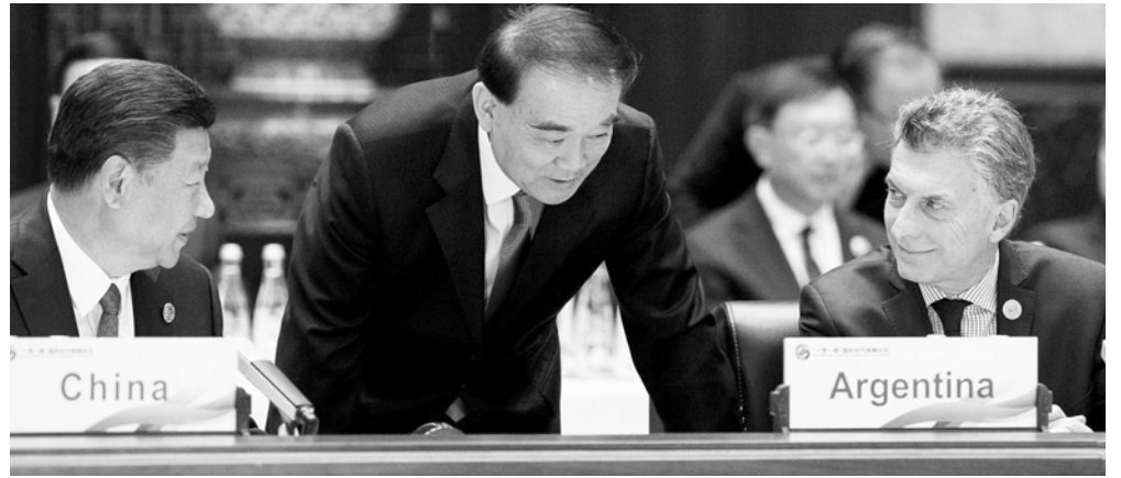
Xi Jinping, jefe del estado chino, a la izquierda.