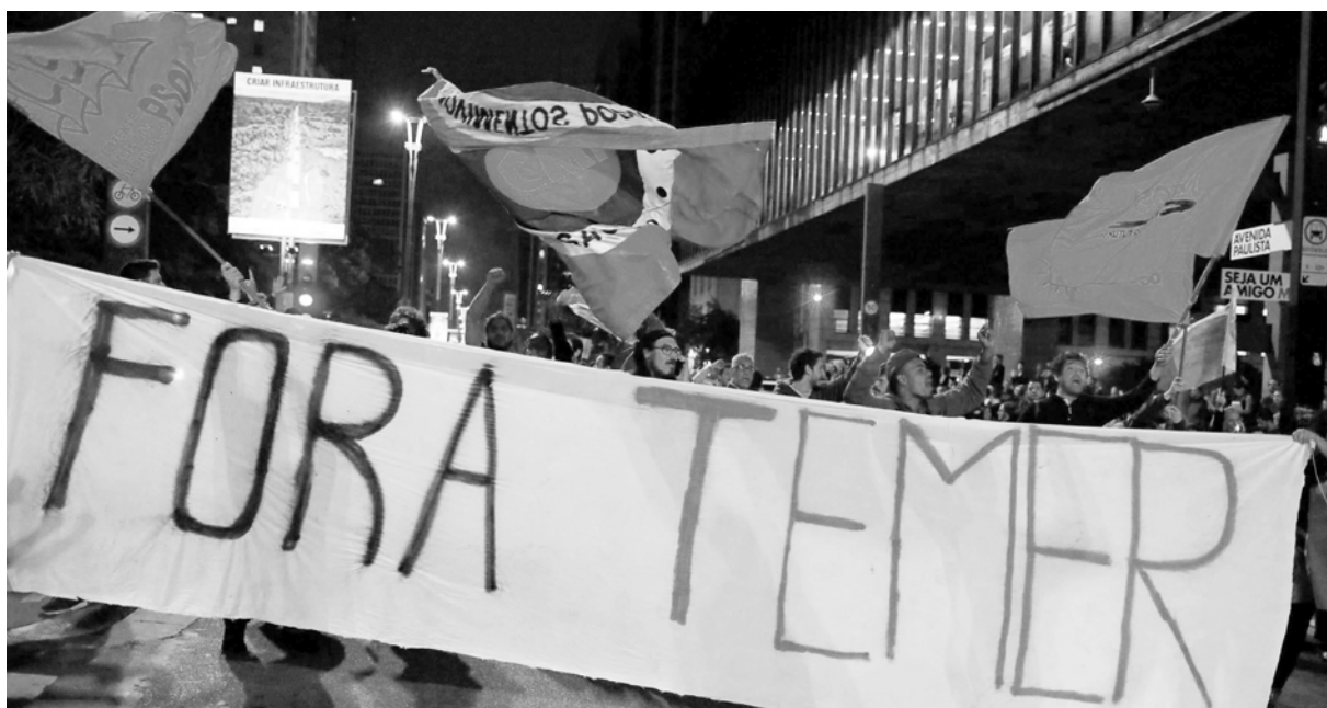
Movilización contra Temer en Sao Paulo

El avance de las movilizaciones abrió una enorme crisis en las altas es-