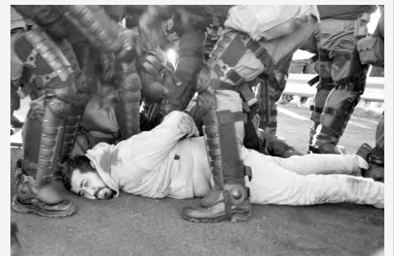
Represión contra trabajadores estatales